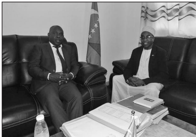
Le gouverneur de Ngazidja par intérim reçu par le ministre des finances

La Gazette des Comores Le devoir d'informer, la liberté d'écrire